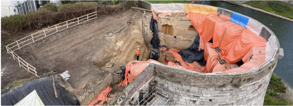
Rondeel Vijf Koppen.